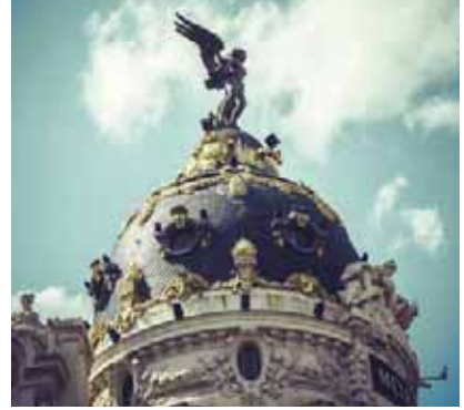
Edifício Metrôpolis (Madrid)

se conservam importantes tesouros, entre eles a "Pietà" de Michelangelo, o "Baldaquino" de Bernini, situado sobre o túmulo de São Pedro, em bronze dourado, e os monumentos fúnebres dos papas realizados através dos séculos pelos artistas mais ilustres. Terminaremos na magnífica Praça São Pedro, e sua Colunata, uma das maiores do mundo, de Bernini, uma vez mais o artista optou pela forma oval, definida por quatro filas de colunas, que, no entanto, parecem uma só para aquele que se situa sobre os dois focos da elipse, em cujo centro está o Obelisco. Tempo livre que poderá aproveitar para visitar por conta própria as Basílicas Maiores e Catacumbas. Acomodação.