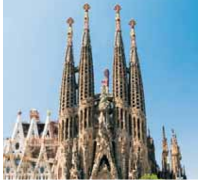
La Sagrada Família (Barcelona)