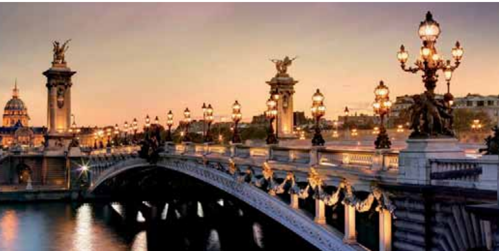
Pont de Alexandre (Paris)

Café da manhã buffet. Hoje tenemos uma visita opcional interessantíssima aos Museus Vaticanos, Capela Sistina e ao interior da Basílica de São Pedro. Começaremos visitando os Museus Vaticanos, que foram os antigos palácios papais, o grande pátio da Pinha, a sala da Cruz, a Galeria dos Candelabros, a dos Tapetes, a dos Mapas, a sala Sobiesky e da Imaculada, no final entraremos na Capela Sistina, grande obra-prima de Michelangelo, com todos seus afrescos restaurados. Depois passaremos à Basílica de São Pedro, construída no lugar do martírio do Santo e depois reconstruída; dela se destaca sua imponente cúpula, obra-prima de Michelangelo. Em seu interior