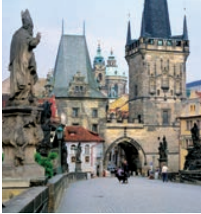
Ponte de Carlo (Praga)