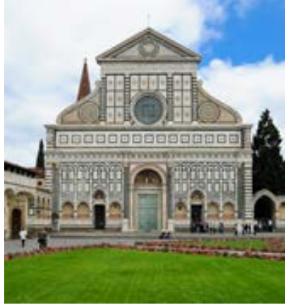
Igreja de Santa María Novella (Florença)