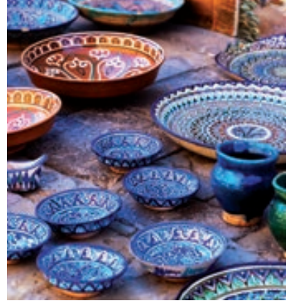
Mercado de artesanato

tes como a mesquita Djouma, os mausoléus, as madraças e os dois magníficos palácios construídos no início do século XIX pelo Khan Alla-kouli. No interior, vamos ver o minarete Kalta Minor, a cidadezinha Kunya Ark, Madraça Mohammed Rahim Khan, Minarete e Madraça Islom Khodja. Almoço no restaurante. Visita do complexo arquitetônico Tash Hovli (século XIX), Mausoléu de pahlavan Mahmud, onde está localizada a Mesquita Juma. Terminaremos o dia curtindo o pôr do sol no Bastion Ak Sheikh Bobo. Jantar em restaurante e hospedagem.