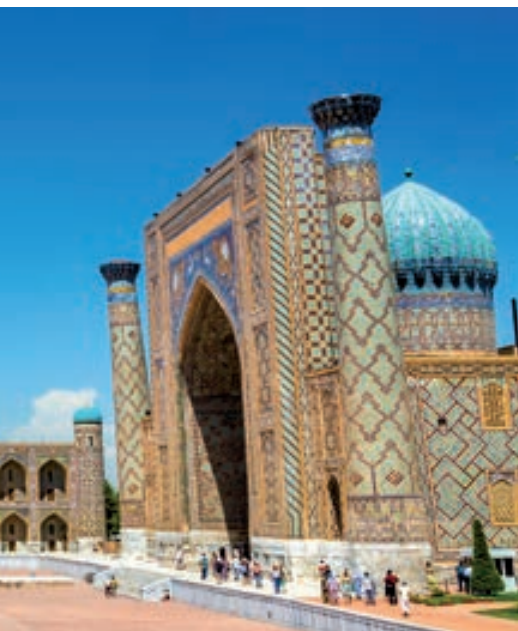
Praça de Registán (Samarcanda)

Buffet de café da manhã. Na hora indicada, traslado para o aeroporto. Fim da viagem e nossos serviços.