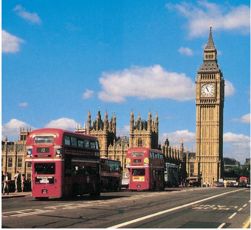
Big Ben (Londres)