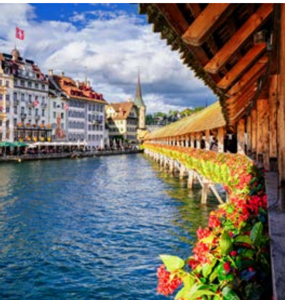
Puente Chapel (Lucerna)